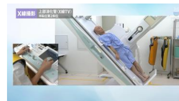
医用画像・診療放射線動画 Medical Imaging