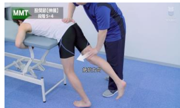
理学療法 physical therapy

メディカルオンラインビデオは医師や看護師、医療技術者、学生など、あらゆる医療関係者のための新しい医療動画配信サービスです。手術や各種手技など、多彩なラインアップで学生から医療従事者まで幅広い層にご利用いただけます。